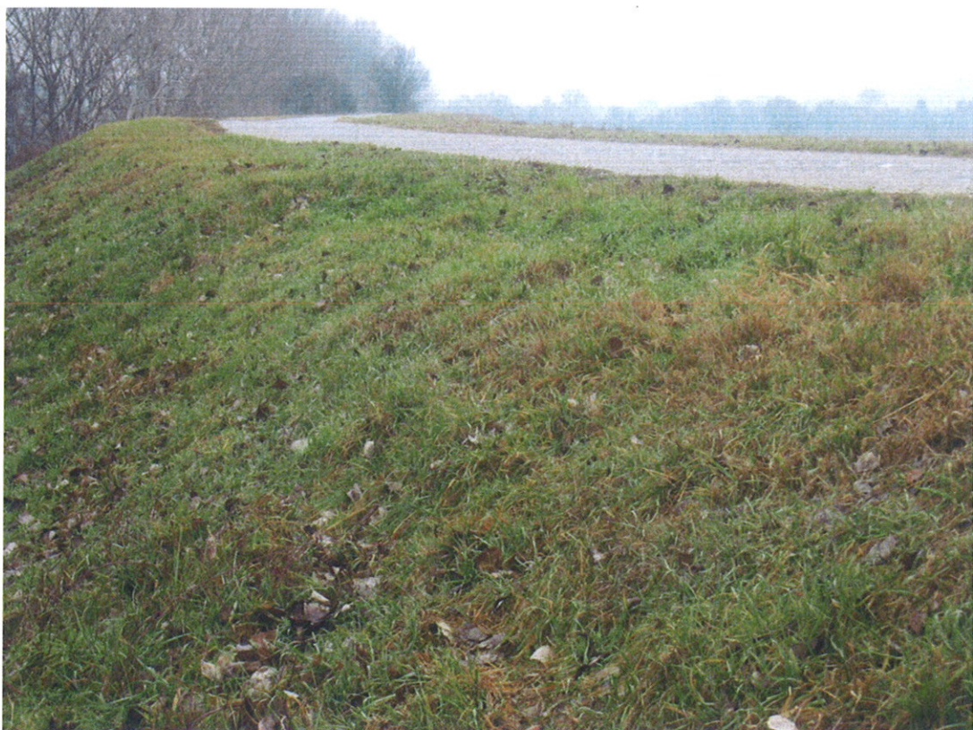
Cedimento banchina sinistra Mincio tra i SS. GG. 41-42 Comune di Roncoferraro (MN)