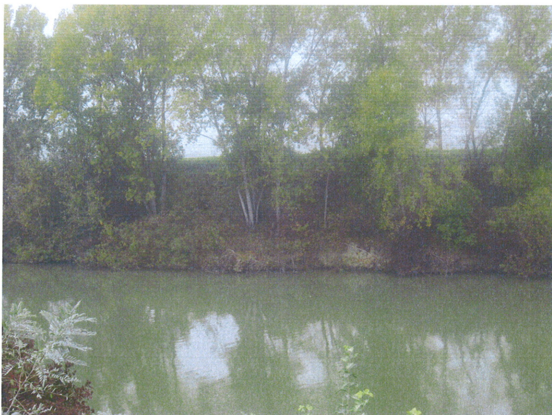
Cedimento banchina spondale in sinistra fiume Mincio tra i SG 50-52 in Comune di Roncoferraro (MN)